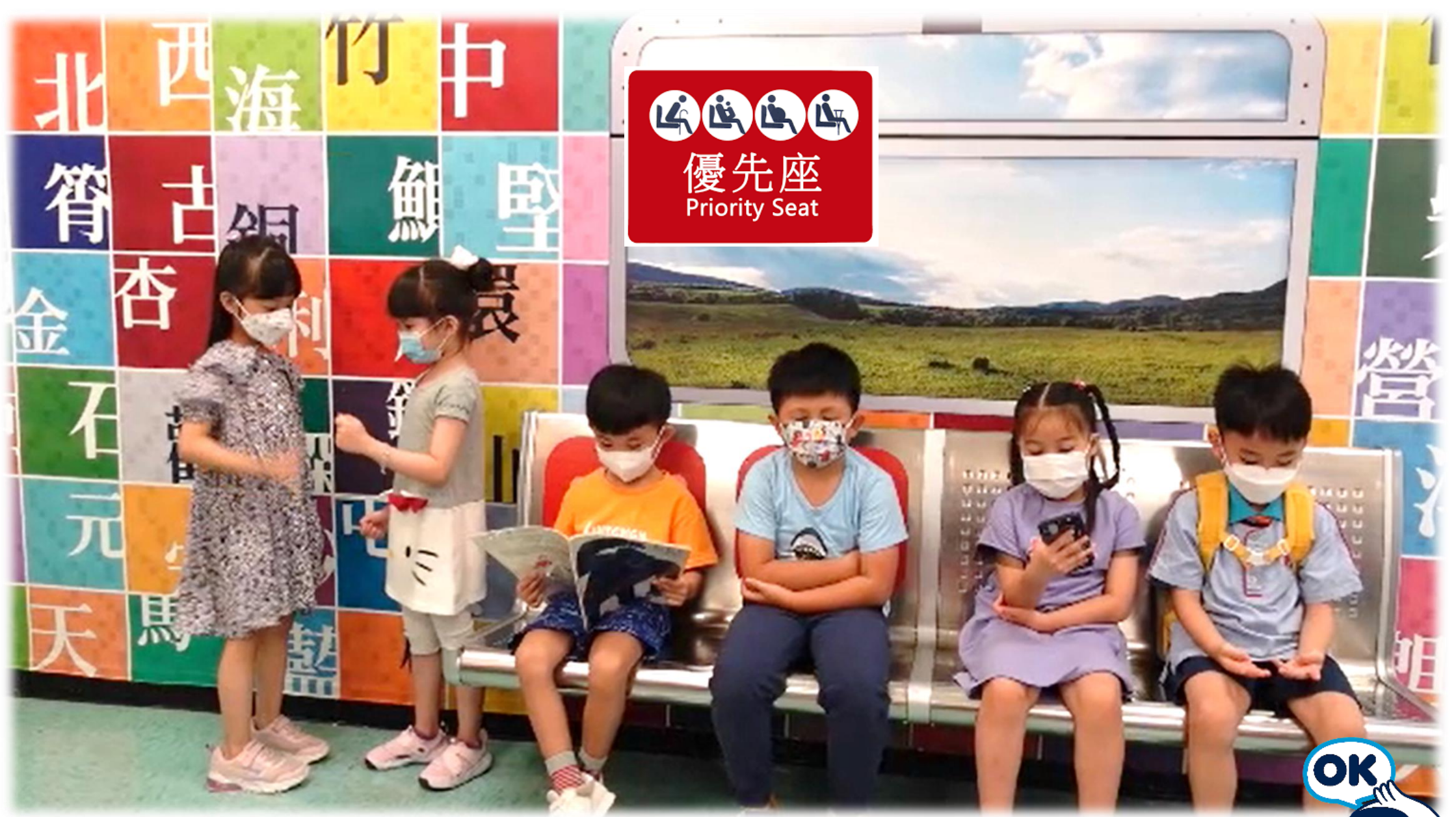
港鐵列車到達車站後，車廂裡擠滿乘客，已經沒有座位。